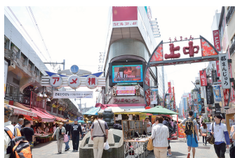
⑥ アメ横センタービルY字路