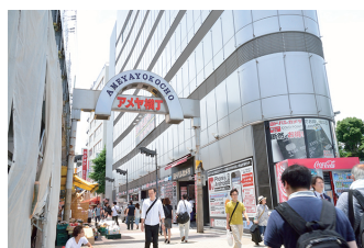
⑦ アメ横入り口(JR上野駅側)