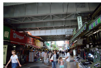
④ 高架下交差点付近(中央通り向き)