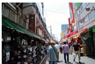
⑤ 高架下交差点付近(上野駅向き)