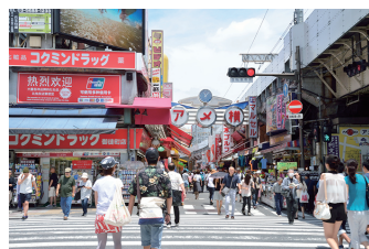
① アメ横入り口(JR御徒町駅側)